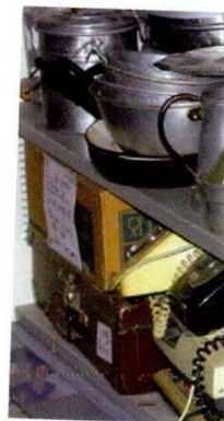
תצלומים של חפצים ישנים שזוהו שומרת למוזיאון עתידי לבתי הילדים