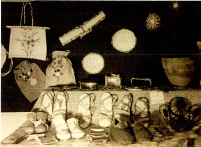
דוגמה לתעלום בקטגוריה 'חינוך' בארכיון: פעילות של מערכת החינוך בקיבוץ. תערוכת סוף שנה של עבודות תלמידים, קבוצת תומר 1952, ארכיון קיבוץ שער הגולן.

במצבי אמת, ובנו זהות של קהילה ייחודית בעלת ייחוס חברתי מוגדר, בדומה לארכיונים שהוקמו כדי לשרת קבוצות אתניות ותרבויות ספציפיות. ב־בזמן תפס הקיבוץ את עצמו כחלק נורמטיבי ובלתי נפרד של החברה הישראלית. השניות טמונה בעובדה שהחברה הקיבוצית עשתה מאמץ גדול לבנות ארכיונים שמשקפים חברה נורמלית ונורמטיבית לכל דבר, אך הגדירה את עצמה חברה נבדלת. לפי התפיסה שרווחה בתנועה הקיבוצית בימי ראשית המדינה חיייהם של אנשי הקיבוץ היו ראויים יותר מחייהם של שאר תושבי המדינה, אשר חיו חיים שגויים, דלי ערכים ופחותי מוסר. מזווית ראייתו של הארכיון חיה שאר החברה הישראלית את חיי ה'אחר' בעוד חברי הקיבוץ, כפי שהם מיוצגים בארכיון, הם 'אנחנו'. הארכיונים עודדו אפוא פיתוח תחושה של נורמליות בתוך הקהילה הקיבוצית.