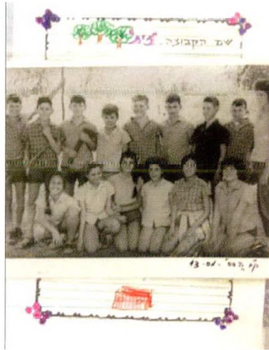
תצלומי ילדים לפי קבוצות בכתי ילדים: קבוצת זית וקבוצת ערבה.

אפוא פעמיים, עם קבוצת הילדים בקטגוריית 'חינוך', ועם הוריהם הביולוגיים בקטגוריית 'משפחות'. כך החדירה זיוה את התפיסה שלמשפחה הביולוגית יש זכות לגיטימית להתקיים בתודעת הקיבוץ, שהקיבוץ לא החליף את מקומה של המשפחה, ושהילדים שייכים קודם כול להוריהם ורק אחר כך לקיבוץ.