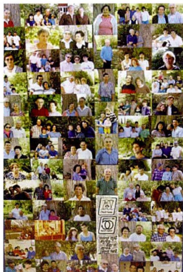
פורטרט משפחתי של חברי הקיבוץ, הפקה מקורית מ־1987 והפקה חוזרת בשנת 2000 הכוללת בתוכה את כל חברי המשק ומשפחותיהם, אלה שעזבו את הקיבוץ ואלה שחיים בקיבוץ